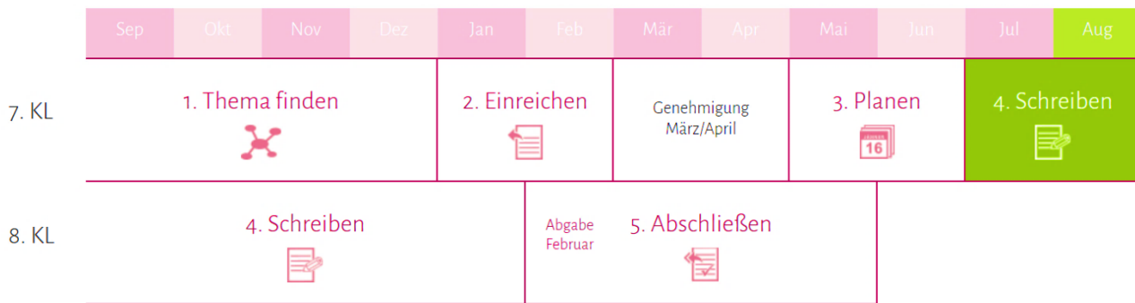
Abbildung 1: Übersichtsplan zur ABA 6